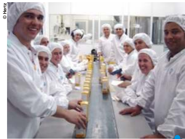
Interação: hoje, os colaboradores da Hertz têm acesso direto à área estratégica de RH

também passou a valorizar a prática do feedback e a receptividade das pessoas tem sido satisfatória, uma vez que todos podem contar com a ajuda do RH sempre que for necessário.